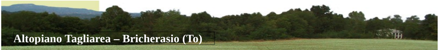
Altipiano Tagliarea – Bricherasio (To)

Si svolgerà venerdì sera 12 Giugno 2015 la seconda edizione dell'evento podistico non competitivo e comprendente la corsa nonché la sezione camminata e walking nella originale cornice del suggestivo altipiano della Tagliarea di Bricherasio.